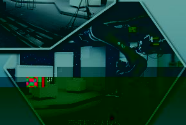
影视多媒体制作室